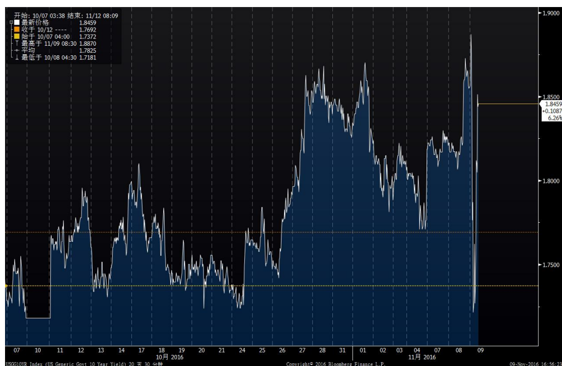
图 2 美国 10 年期国债收益率走势图

走势。据巴克莱预测，特朗普当选后标普 500 指数将下挫 13%。全球最大对冲基金 Bridgewater 认为，如果特朗普赢得美国大选，全球股市会崩盘，预计美股会大跌 10.4%，欧股下跌 10.8%。与此同时，主要避险产品受到投资者追捧。伦敦黄金现货价格在盘中一度冲高至 1337 美元/盎司，收复了近一个半月的下行缺口。美国国债也引发市场投资者的高度关注。10 年期国债收益率盘中从 1.887% 的高位跌至 1.7181%，下跌了 116.89 个基点，触及一个月内低谷。