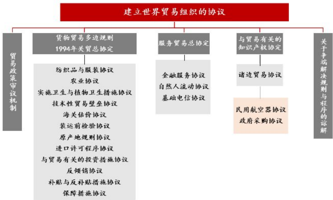
图 1 WTO 的协议框架

当前国际贸易体系是以世界贸易组织（简称 WTO）为核心的多边贸易体制，其宗旨是大幅度削减关税和其他贸易壁垒，更重要的是要消除国际贸易中的差别性歧视待遇，促进国际贸易公平化和自由化，以充分利用世界资源，提高全球福利水平。虽然世界贸易组织 1995 年才成立，但多边贸易体制已有近 70 年的历史。1948 年生效的《关税与贸易总协定》（简称《关贸总协定》）就已为多边贸易体制制定了规则。WTO 于 1995 年 1 月 1 日正式开始运作，其基本原则是通过实施市场开放、非歧视和公平贸易等原则，来实现世界贸易自由化的目标。WTO 涵盖货物贸易、服务贸易以及知识产权贸易，在调解成员争端方面具有较高权威性。WTO 与国际货币基金组织、世界银行被称为世界经济稳定的三大支柱。《关贸总协定》和 WTO 制定了一系列涉及国际货物贸易、国际服务贸易以及与贸易有关的国际投资和知识产权等方面的国际规则，并创设了结合外交谈判和法律方式解决成员纠纷的争端解决机制。当前，多边贸易体制为全球范围内的贸易自由化、世界经济的稳定和发展发挥了非常积极的作用。