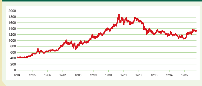
金價，自2005年至2016年9月30日（美元/盎司）