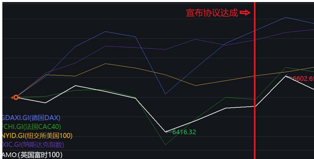
图 1. 脱欧协议达成前后欧美主要股指走高

但英国成功脱欧或成为逆全球化的标志性事件 1 ，减弱欧盟以及其它国际组织和协定的向心力。