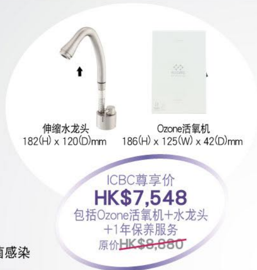
伸缩水龙头 182(H) x 120(D)mm