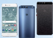
HUAWEI P10 Plus 智能手機 (皓月銀色/鑽雕藍色/曜石黑色)