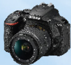
Nikon D5600 數碼單鏡反光相機 連18-55mm鏡頭套裝