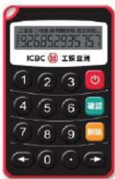
工銀亞洲電子密碼器示意

請在“工銀電子密碼器”中輸入 5517451 上圖內容包括收款人賬號中隨機6位元數位和轉賬金額，請仔細核對。 請按“工銀電子密碼器”的“確認”鍵獲取動態密碼，有保證動態密碼有效，請儘快完成交易。 請輸入動態密碼：