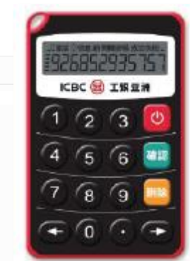
工銀亞洲電子密碼器示意