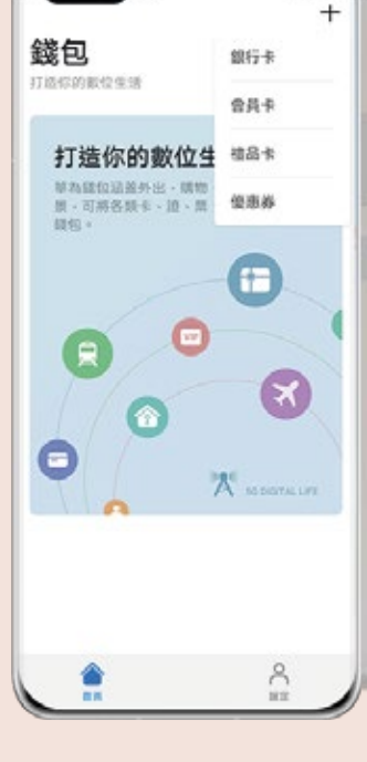
02 點擊「+」, 選擇「銀行卡」