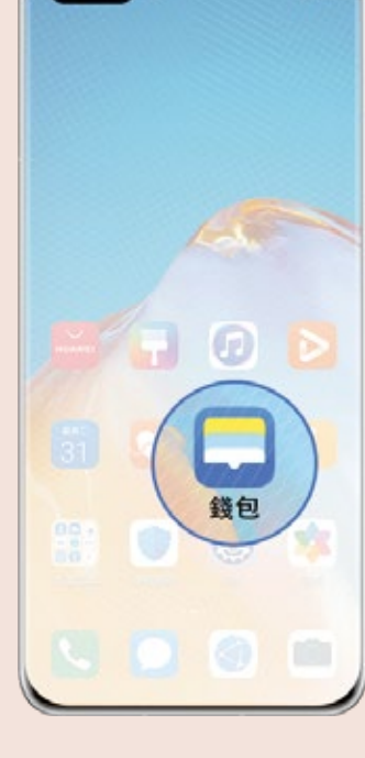
01 在支援 Huawei Pay 的手機* 打開「錢包」App

於 Huawei Pay 加入 ICBC 銀聯信用卡 只需幾個簡單步驟, 就可以把 ICBC 銀聯信用卡 # 加至 Huawei Pay。