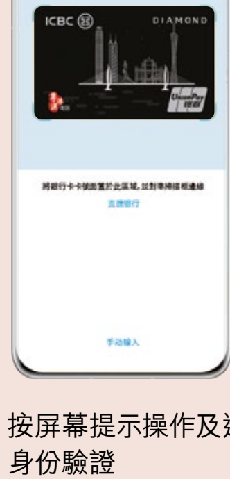
03 按屏幕提示操作及進行身份驗證