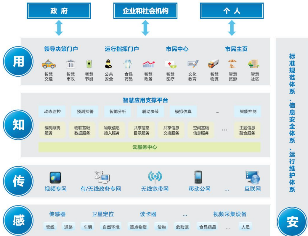
图2 智慧城市的运行体系